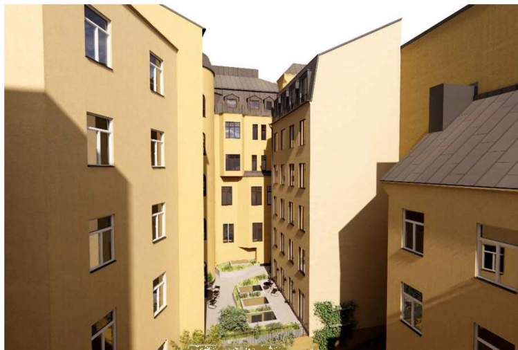
Visionsbild av det nya bostadshusets sett från Snöklockan 3, med vilken Snöklockan 4 visuellt delar innergård. Till höger i bilden syns bakomliggande brandvägg och intilliggande gårdshus. Bild: Fidjeland Wolgers Wiklander arkitektkontor.

struktur. Kvarterets kulturhistoriskt värdefulla byggnad, från 1900-talets början, bevaras till stora delar. Detaljplanen omfattar även skydds - och varsamhetsbestämmelser samt rivningsförbud med syfte att skydda den befintliga byggnadens kulturhistoriska värden.